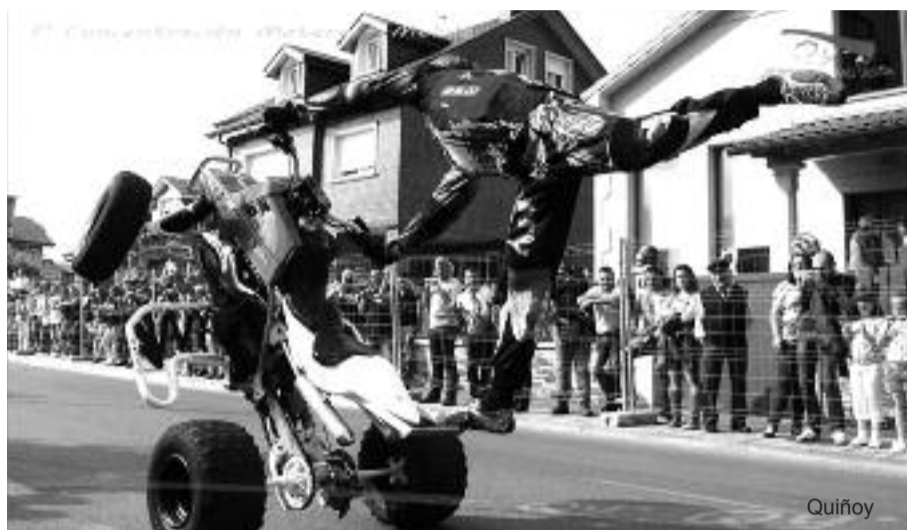
Os espectáculos acrobáticos sobre rodas son os máis seguidos polo público

Coa chegada do verán comeza en Melide a época na que cada fin de semana é un fervedoiro de actividades. A esa axenda estival frenética súmase dende hai dous anos a concentración moteira organizada polo club Millí Riders, que congrega na vila a centos de afeccionados ao motor chegados de toda Galicia. A terceira edición, que se celebrará os vindeiros días 4 e 5 de xullo, incorpora un novo atractivo en forma de espectáculo: La Edad de Oro del Pop Español dará o sábado 4 un dos seus cinco concertos previstos para Galicia e traerá á vila cancións de grupos míticos dos 80,s. Sobre o escenario, e con música en directo, estarán Alberto Comesaña (Amistades Peligrosas), Pablo Perea (La Trampa) e Joaquín Padilla (Iguana Tango). Malia ser un dos pratos fortes, non será o único; a concentración tamén brindará un ano máis a oportunidade de ver shows acrobáticos e levará as motos de ruta pola comarca.