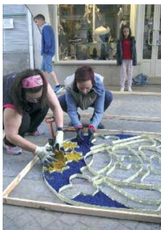
Dúas voluntarias confeccionan o escudo de Melide