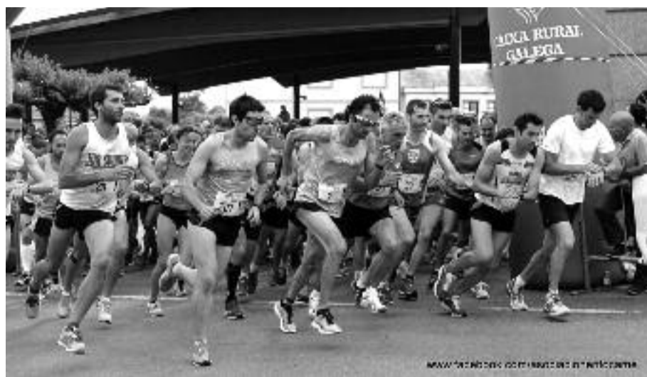
Saída da carreira dende Palas de Rei na edición de 2014

O 27 de xuño volve Os 21 do Camiño, o medio maratón entre Palas de Rei e Melide que na súa curta historia conseguiu situarse xa no Top Ten das carreiras preferidas polos afeccionados galegos. Logo do cambio de data do ano pasado, a carreira incorpora na súa terceira edición unha importante novidade: o cambio de percorrido no tramo final. Evitaranse así os dous quilómetros que transcorrían polo casco urbano de Melide e que a xuízo da organización "desvirtuaba a beleza do resto do percorrido", que transcorre integramente polo Camiño de Santiago. Quérese potenciar así esta peculiaridade da carreira e un dos grandes atractivos para os corredores, cuxo número non deixou de aumentar edición tras edición. O obxectivo este ano é chegar ao límite de inscricións permitidas (700) ou cando menos superar os 562 participantes de 2014. Non falta moito, pois ao peche de edición deste xornal xa eran 560 os participantes confirmados.