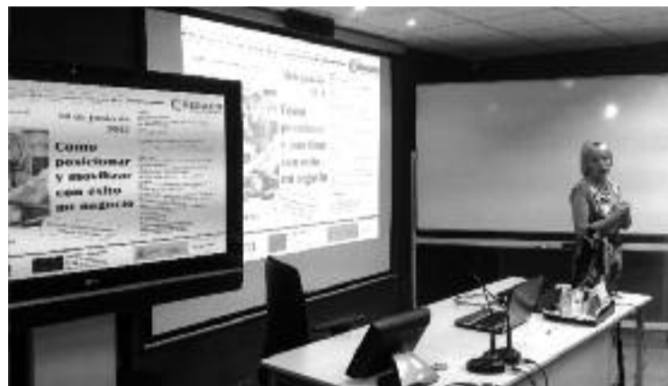
O obradoiro impartíuse no Edificio Multiusos

A Cámara de Comercio de Santiago, en colaboración co Concello de Melide, organizou na vila a mediados de xuño un obradoiro gratuito sobre a xestión de pequenos e medianos negocios no que os participantes puideron acceder a algunhas das claves para dinamizar con éxito os negocios. O obxectivo da xornada, que durou catro horas, consistiu en ofrecer pautas para saber comportarse ante os cambios que se están a producir no sector e para mellorar o negocio en diferentes aspectos: visualmente, a nivel de vendas, na atención ao cliente ou na escolla do público ao que debemos dirixir os nosos produtos. Por outra banda, tamén se abordaron as novas tendencias á hora de vender e tanto os novos hábitos de consumo como os novos perfís de clientes que están aparecendo. Aprender a posicionar a imaxe de marca no mercado foi outro dos asuntos que se tratou no obradoiro.