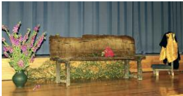
Banco de madeira centenario convertido polos Melidaos nun símbolo da música cantada en galego