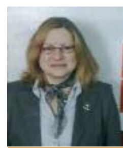
Begoña López PSOE