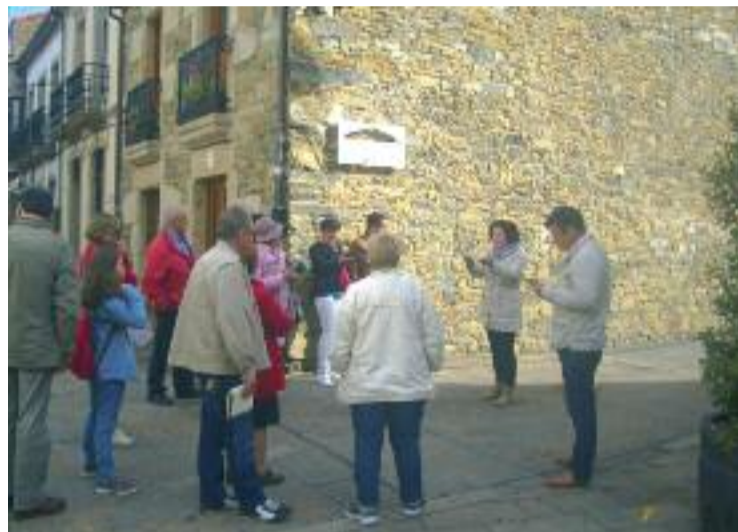
Participantes na primeira visita guiada que se realizou este ano