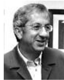
Miguel Buján PSOE