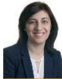
Ánxeles Vázquez PP