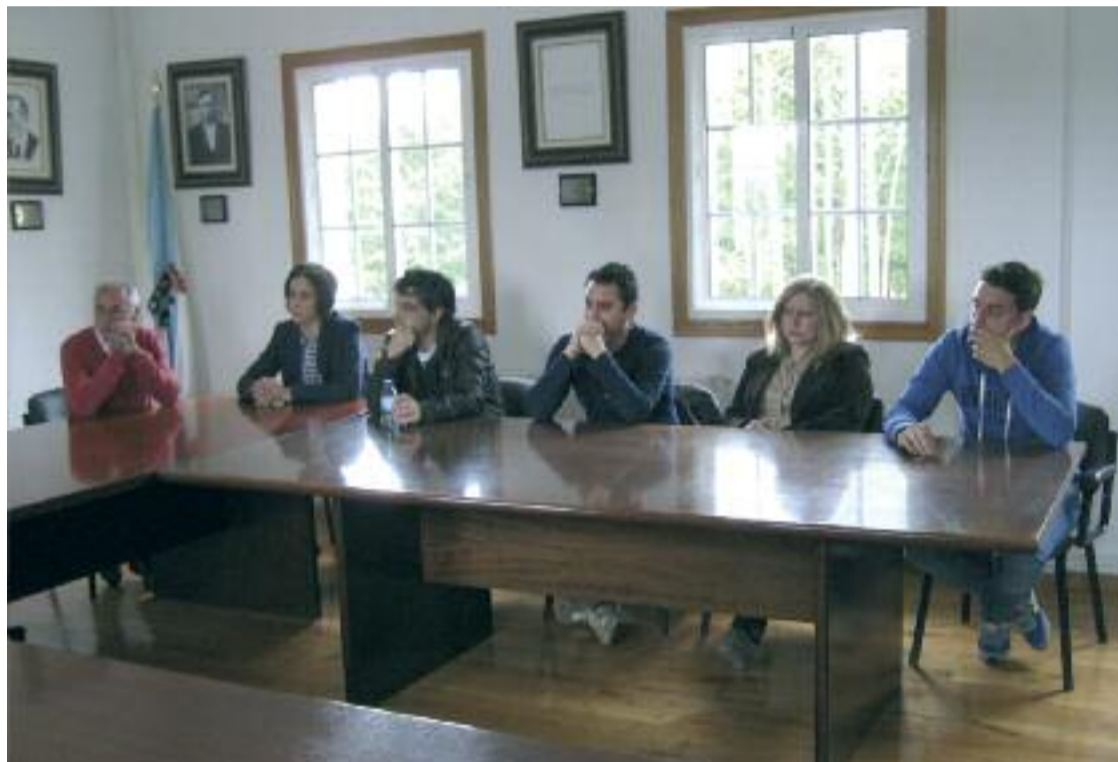
Concelleiros do bipartito no pleno de investidura minutos antes da votación

"Cada un crese con forza suficiente para pedirlle ao ou-