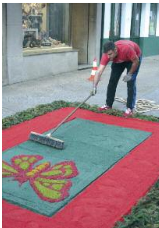
As alfombras florais requiren paciencia e bo pulso