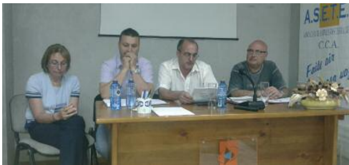
A xerenta, o secretario, o presidente e o tesoureiro de Asetem durante o transcurso da asemblea